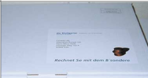
{Abb_1} Detail Versandbox

Seit Jahren ist die DKM - die größte und wichtigste Versicherungsmesse Deutschlands - wichtiger Bestandteil im Kommunikationsmix der Stuttgarter Versicherung. Nicht nur, daß der Stand der Stuttgarter der größte und spektakulärste ist, mit ca. 1500 Besuchern ist er auch einer der am meisten frequentierten. Mit einem aufmerksamkeitsstarken Mailing sollte der Messebesuch noch einmal in Erinnerung gerufen, Dank für ebendiesen ausgesprochen und - am wichtigsten - ein erster Dialog zu den Besuchern und potentiellen Vertriebspartnern aufgebaut und später gepflegt werden. Mit dem „besonderen“ Rechner, der an knapp 1.000 Adressaten verschickt wurde, ist dies nachhaltig gelungen.