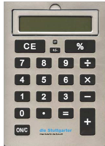
[Abb_5] XXL-Rechner (22 x 31 cm)