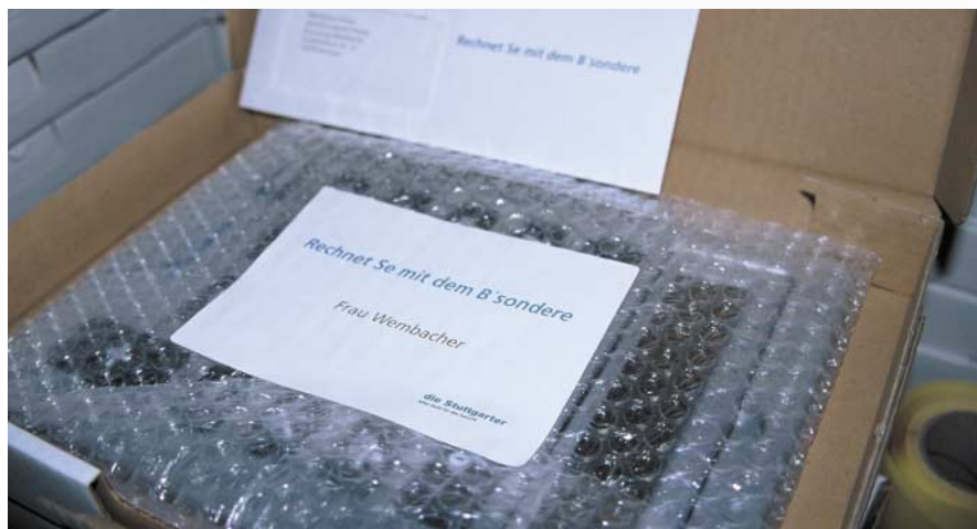
[Abb_7] Inhalt der Box: Brief, personalisiert Sticker, personalisiert XXL-Rechner