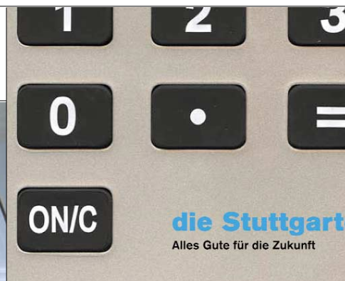
{Abb_2} Detail XXL-Rechner