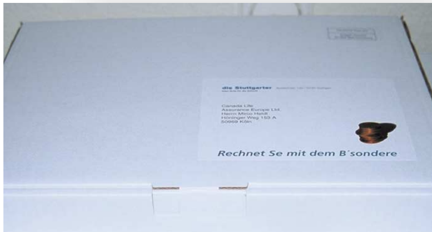
[Abb_6] Versandbox, personalisiert