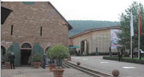
[Abb_13] Veranstal- tungsort