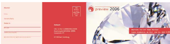
{Abb_7} Gewinnspielkarte, Außenseiten