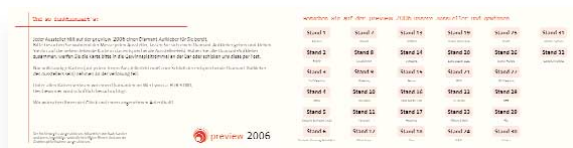
{Abb_8} Gewinnspielkarte, Innenseiten

„Jeder Aussteller hält auf der preview 2006 einen Diamant-Aufkleber für Sie bereit. Bitte besuchen Sie während der Messe jeden Aussteller, lassen Sie sich einen Diamant-Aufkleber geben und kleben Sie ihn auf die nebenstehende Karte in das entsprechende Aussteller-Feld. Haben Sie alle Diamant-Aufkleber zusammen, werfen Sie die Karte bitte in die Gewinnspieltrommel an der Bar oder schicken uns diese per Post.