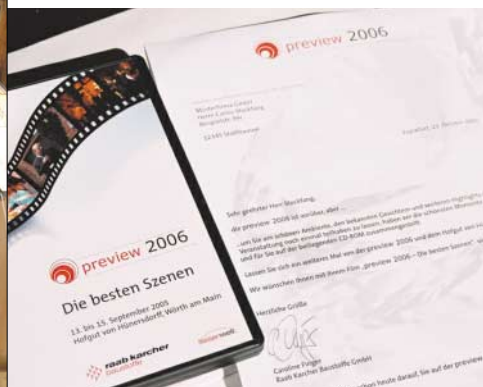
[Abb_16] Mailing, 3. Stufe: DVD an alle Teilnehmer „Die besten Szenen“