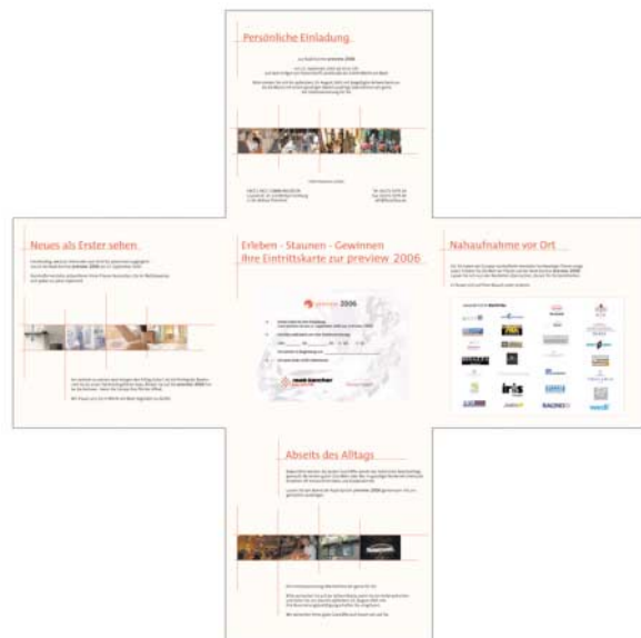
{Abb_6} Einladung, aufgeschlagen, Innenseiten