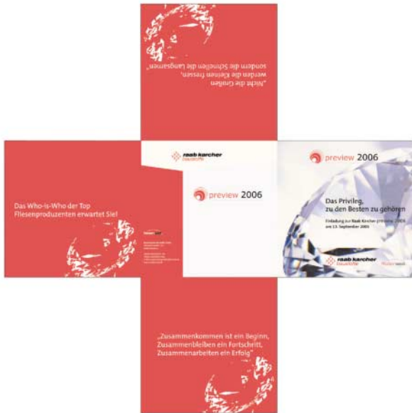
{Abb_5} Einladung, aufgeschlagen, Außenseiten