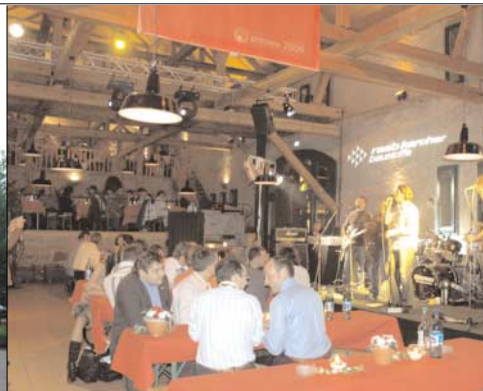
[Abb_14] Abendveran- staltung