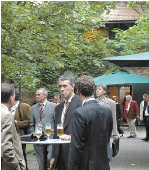
[Abb_9] Pause im idyl- lischen Hof