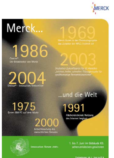
{Abb_7} Plakat 4 1 Woche vor Veranstaltung