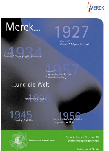
{Abb_6} Plakat 3 2 Wochen vor Veranstaltung