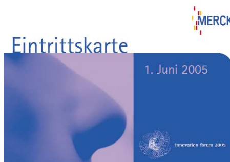
{Abb_3} Eintrittskarte Tag 1