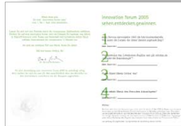
[Abb_10] Einladung_ personalisiert an alle 11200 Mitarbeiter