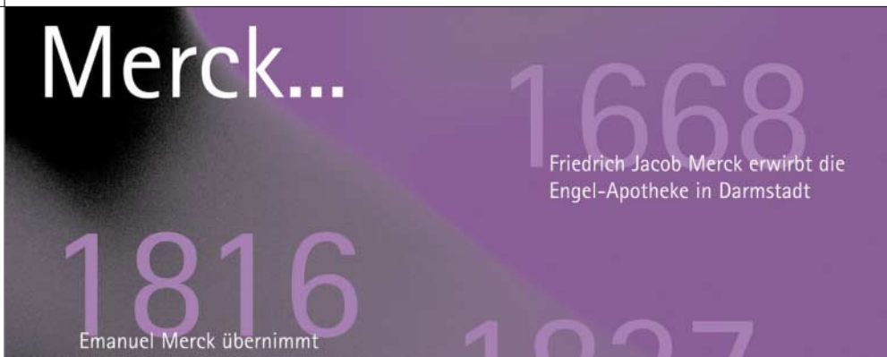
{Abb_1} Detail Plakat Woche 1

Aufgabe war die Kommunikation der Messe und die Steigerung der Besucherzahlen im Vergleich zum Vorjahr. Es wurde ein mehrstufiges Mailing entwickelt, das über 4 Wochen die Messe kommunizierte. Motto: „Merck und die Welt – über 330 Jahre Innovationen“. Flankiert von Postern auf dem Firmengelände, Beiträgen in der Firmenzeitung und im Intranet war die Kommunikation allgegenwärtig. Abgerundet durch ein Gewinnspiel konnte somit eine Steigerung der Besucherzahlen um 827% erreicht werden. Von 420 auf über 3.400.