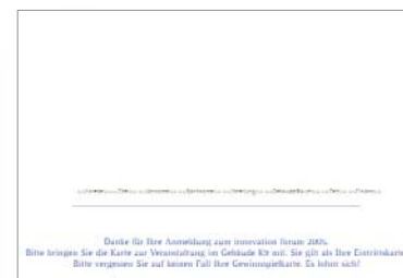
[Abb_11-16] Eintrittskarten_ abteilungsweise an 5 Tagen_ personalisiert