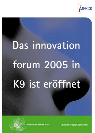
{Abb_8} Plakat 5 während der Veranstaltung