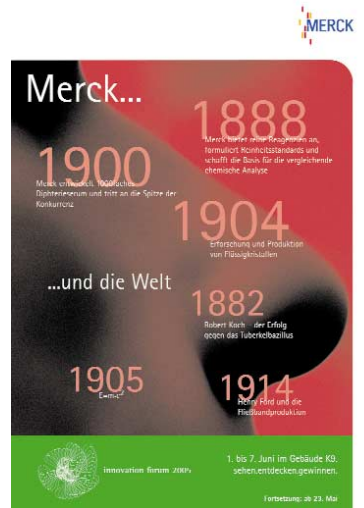
{Abb_5} Plakat 2 3 Wochen vor Veranstaltung