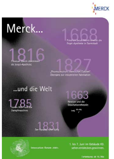
{Abb_4} Plakat 1 4 Wochen vor Veranstaltung