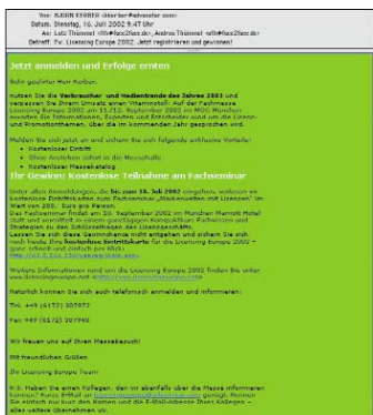
[Abb_18] E-Mail-Newsletter, gesamt 6 Läufe