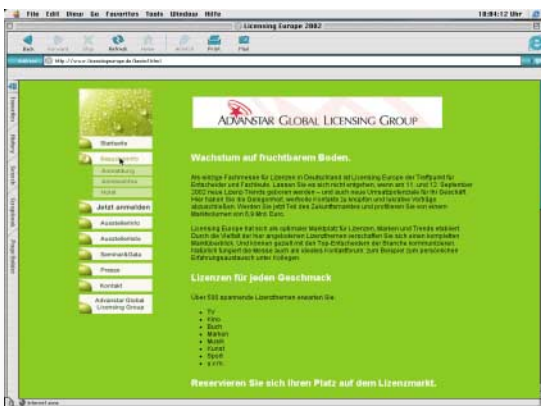
[Abb_16] Beispielseite, Aussteller