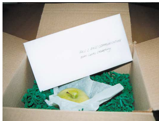
[Abb_29] VIP-Mailing, offen mit Apfel in Seidenpapier, handgeschriebenem Umschlag