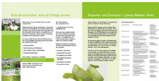
[Abb_20-23] Infobroschüre, quadratisch Beispielseiten