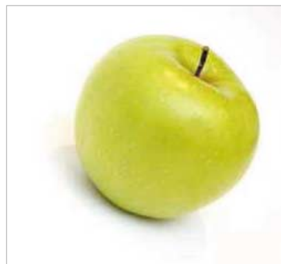
[Abb_32] Der knackige Inhalt