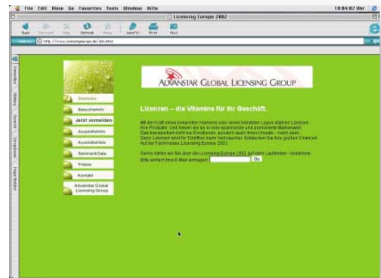
[Abb_15] Beispielseite, Übersicht