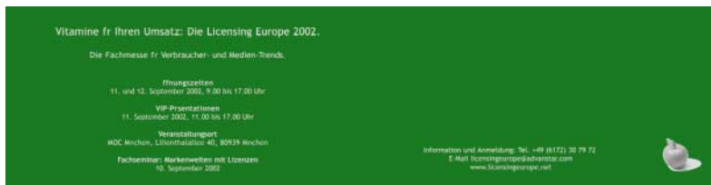
[Abb_31] VIP Einladungskarte in Licensing-Grün eingefärbeter Karton, silber bedruckt