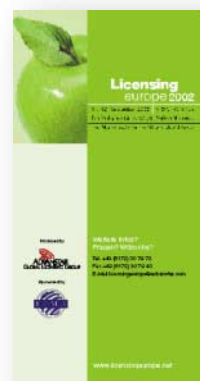
[Abb_25-28] DIN-lang Flyer, Beispielseiten