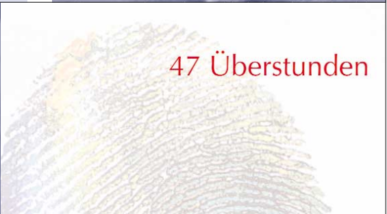
{Abb_4} Detail Anzeige 9