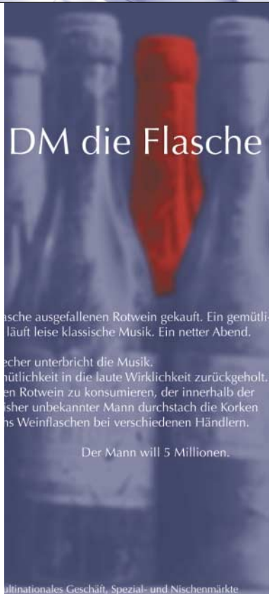
{Abb_2} Detail Anzeige 1