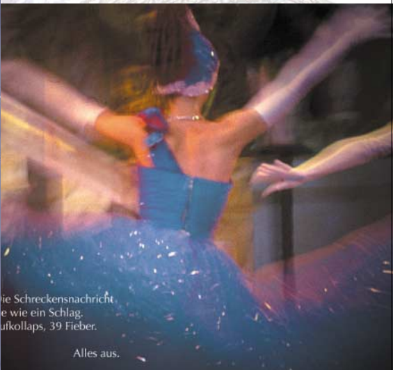
{Abb_5} Detail Anzeige 3