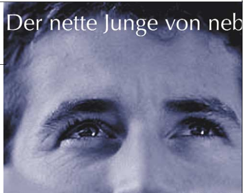
{Abb_3} Detail Anzeige 8