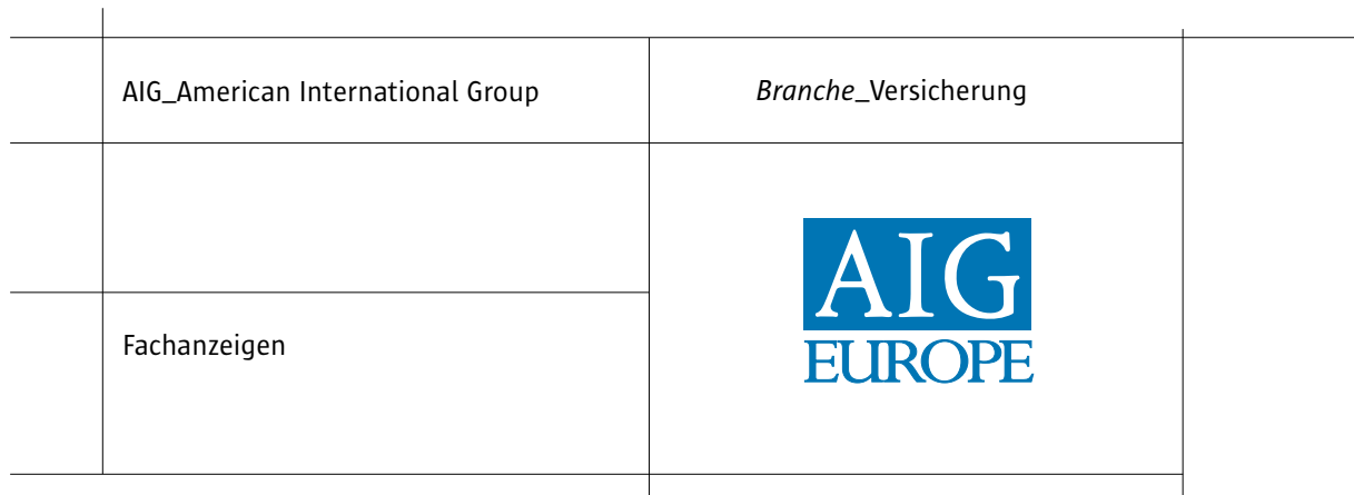
{Abb_1} Detail Anzeige 6