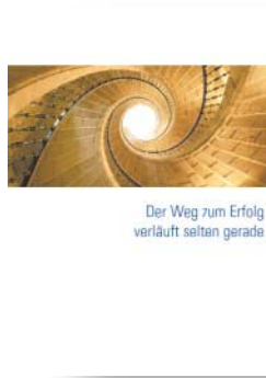
[Abb_5-12] Imagebroschüre, Beispielseiten