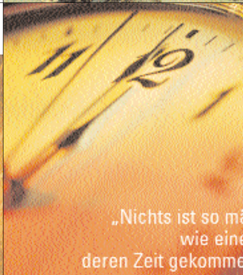
{Abb_4} Detail Unternehmensbroschüre

„Nichts ist so mächtig wie eine deren Zeit gekommen